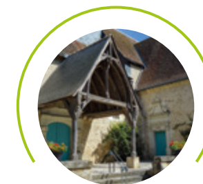
Porche de l'église Portail de style Renaissance encadré de pilastres sur lesquels repose une coquille Saint-Jacques.

En 1893, la commune achète un terrain situé le long du Madelon et y fait bâtir un lavoir. L'édifice de plan rectangulaire, ouvert sur deux côtés, se compose de deux murs en moellons enduits et briques surmontés de planches de bois et couvert d'un toit à longs pans en ardoise. Il a été utilisé jusqu'à la fin des années 1960.