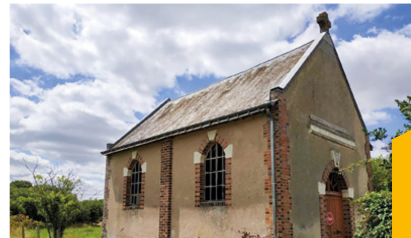
Le Temple Protestant